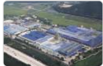
④ 안양공장 : 스틸코드, 비드 와이어