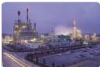
⑥ 용연공장 : 프로필렌, 폴리프로필렌, TPA, NF 3 Gas