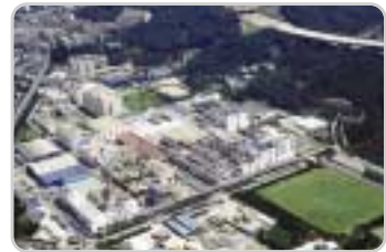
② 안양공장 : 나인론 BCF 카베트, 스펀덱스