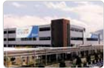
③ 구미공장 : 스펀덱스, 폴리에스터 원사, 폴리에스터 필름, 나인론 필름