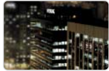
① 서울본사 : 영업 및 관리업무