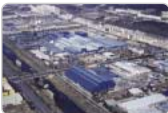
⑦ 창원공장 : 변압기, 치단기, 전동기 외