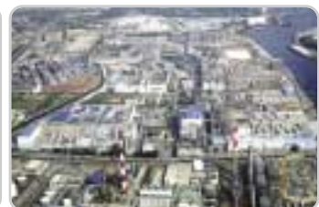
⑤ 울산공장 : 나인론 원사, 나인론 및 폴리에스터 타이어코드지